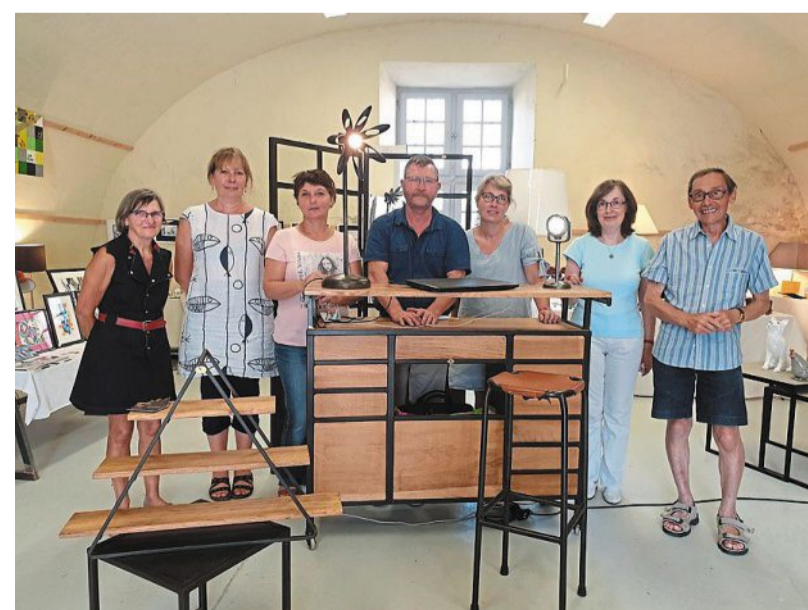
Le collectif Atelier d'art de LoirE a organisé la quatrième édition de son exposition artisanale.