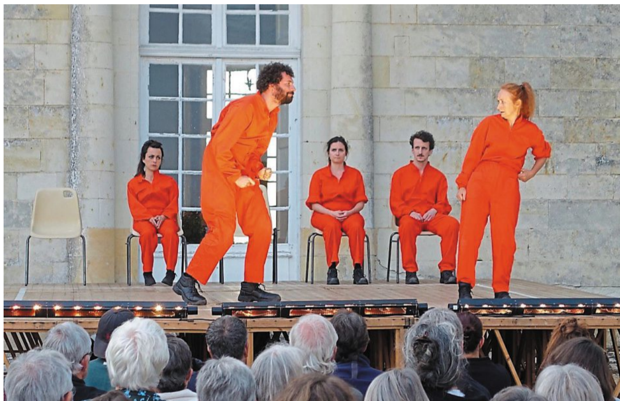
Jarzé, samedi 27 juillet. La troupe du Nouveau Théâtre Populaire a joué la pièce « Les possibilités », de Howard Barker, au château de Jarzé.