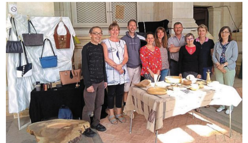
Le collectif d'artisans est jusqu'à dimanche au tribunal de Baugé.

La troisième édition des « Ateliers d'art de LoirE » est proposée au tribunal de Baugé, du mardi 30 juillet au dimanche 4 août, de 10 h 30 à 12 h 30 et de 14 h à 18 h 30. Ce regroupement d'artisans d'art, installés entre le Loir et la Loire propose exposition, vente, démonstrations de savoir-faire, ainsi que des ateliers vannerie et calligraphie sur réservation. « L'histoire a commencé en avril 2017, lors des Journées européennes des métiers d'art. Nous avons créé ce rendez-vous par la suite en août 2017. L'idée est de sortir de nos ateliers pendant une semaine, de se retrouver entre artisans locaux pour montrer notre travail, dialoguer avec le public,