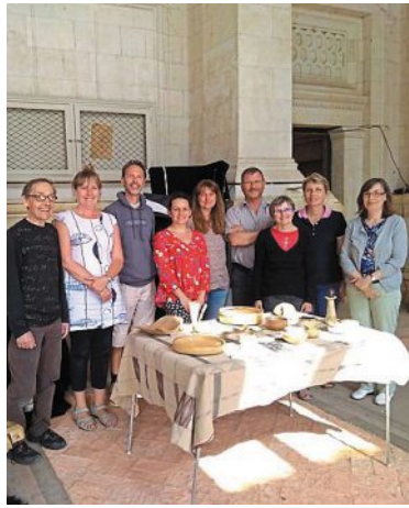
Les artisans lors de l'édition 2019.