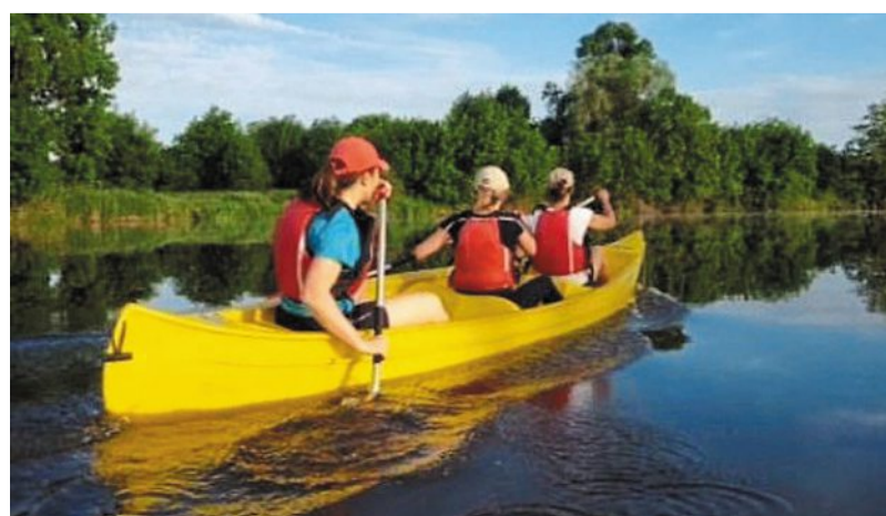
Des kayakistes sur la Sarthe.

Contact : tiercecanoekayak@outlook.fr ou 06 13 04 43 82.