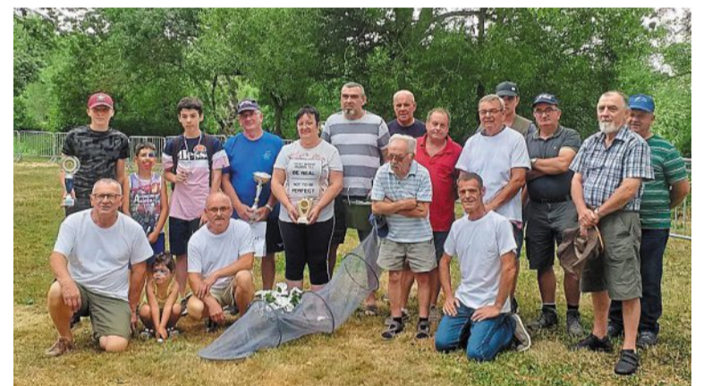
Les participants au concours de pêche.

« Seiches en fête » s'est déroulée samedi 20 juillet au Parc des Vallées. Organisée par le comité des fêtes, c'est le traditionnel rendez-vous de l'été. Les festivités ont débuté par le concours de pétanque et celui de pêche. Ce dernier est géré par l'association locale des Pêcheurs du Loir, 13 partici-