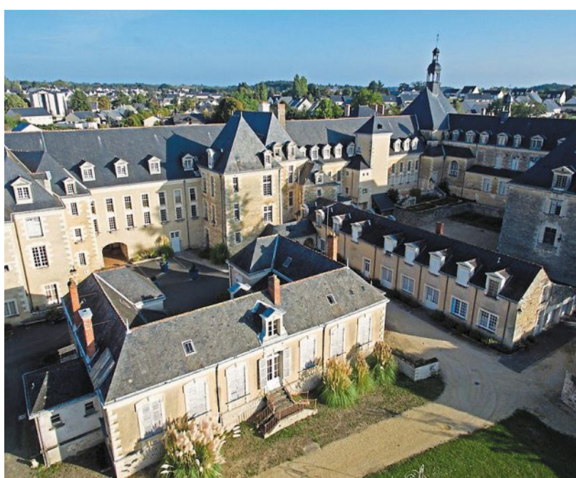
L'Hôtel-Dieu de Baugé-en-Anjou propose une enquête historique au sein de cet ancien hôpital de 1650.

De 5 à 8 joueurs. A partir de 14 ans. 15 € par personne. Réservation obligatoire : 02 41 84 00 74. Suivre le challenge sur www.facebook.com/chateau.debaugé.page/