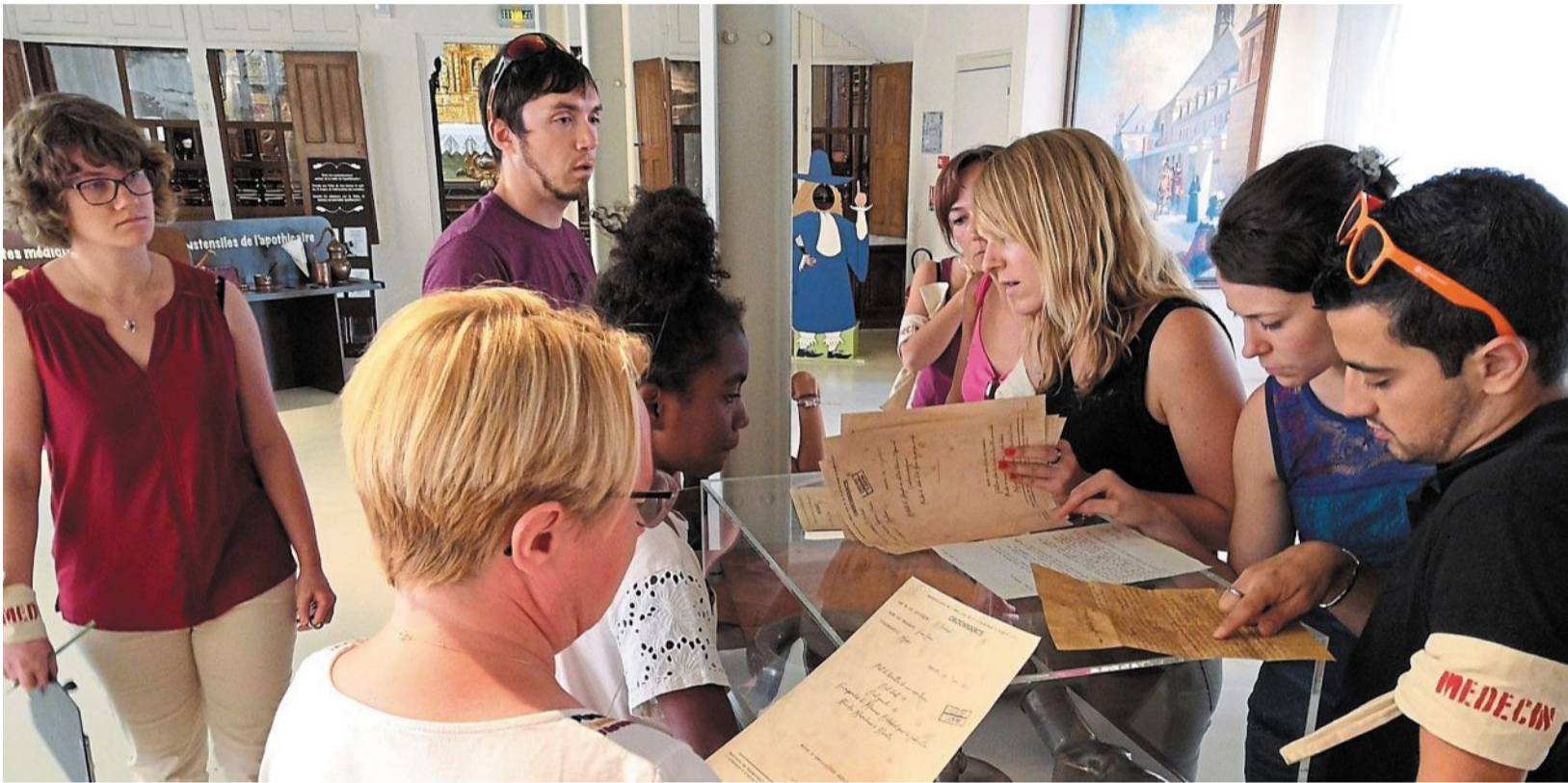
Les « Winners », première équipe à tester l'enquête historique proposée à l'Hôtel-Dieu de Baugé, a résolu l'énigme en 1 h 17. Saurez-vous faire mieux ?

Saurez-vous démêler les mystères des morts qui sourient ? L'Hôtel-Dieu organise une enquête historique en son sein, tous les mercredis d'été. Nous avons assisté à la première.