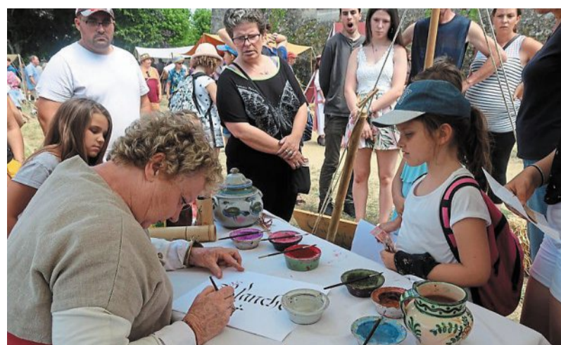
Les stands des calligraphes n'ont pas désespéré. Chaque enfant est reparti avec son prénom tracé à la plume.