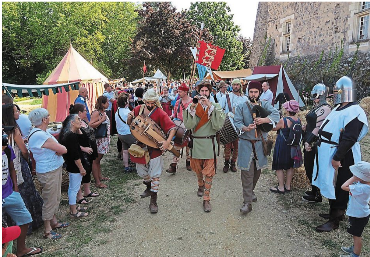
Baugé, dimanche 14 juillet. La fête a débuté par une joyeuse parade médiévale dans les rues du centre-ville, menée par les musiciens du groupe Soñj.