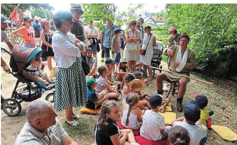
Au XXI e siècle comme au Moyen Âge, les contes fascinent toujours autant les petits et les grands.