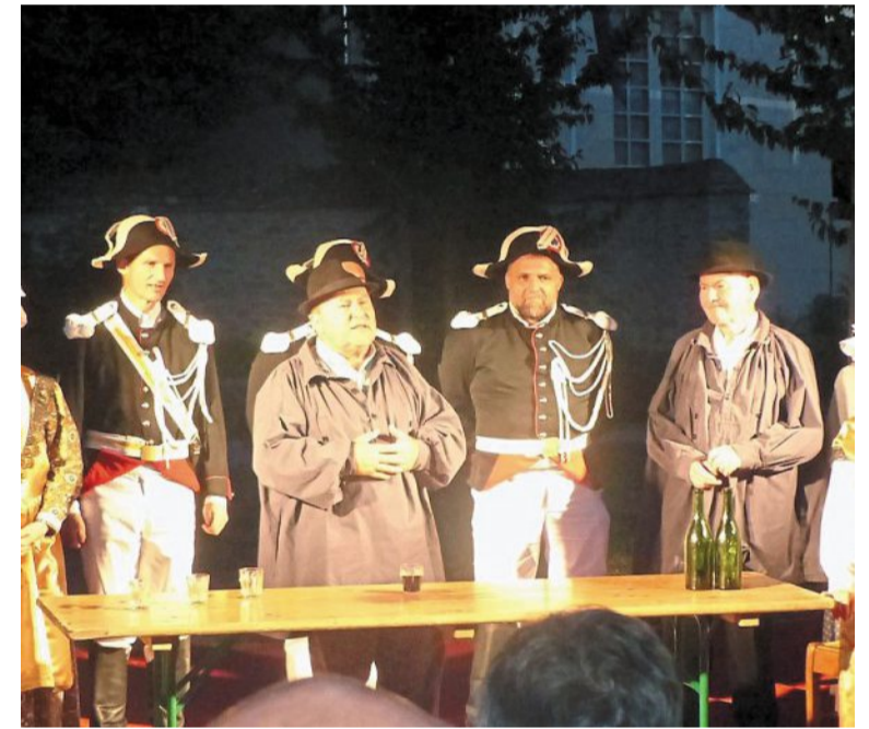
Des extraits de « Rouget le Braconnier » ont été joués par la troupe de Daumeray.

Une restauration était assurée par le restaurant de Cornillé et un foodtruck. La soirée s'est clôturée avec les projections lumineuses sur l'église Saint-Malo et la mairie. Une belle manière d'évoquer l'histoire de ce village pittoresque.