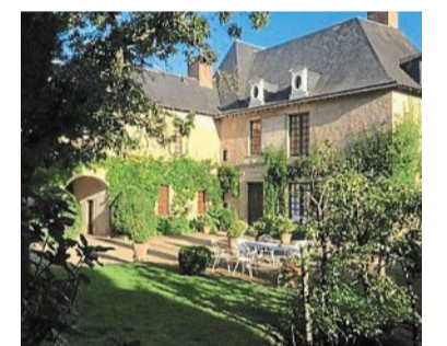
Le Clos Saint-Léonard accueille cette première « Soirée O'Jardin » de la saison.

C'est donc au Clos Saint-Léonard, chambres d'hôtes à Durtal, que se tiendra la première « Soirée O'Jardin » de la saison ce vendredi 21 mai, de 18 heures à 20 h 30. Dans l'enceinte de cette maison du XVIII e , se produira le groupe de musique latine Los Faros. Il sera également possible de se restaurer, avec un apéritif de tapas sur ardoise et sangria.