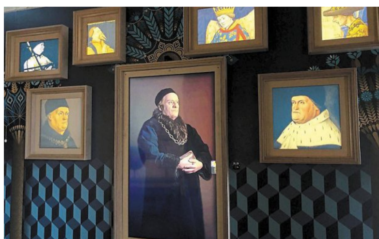
Grâce aux nouvelles technologies, le roi René (dans un tableau qui s'anime) accueille le public dans son palais. On le croise au premier étage, juste avant la salle de banquet.