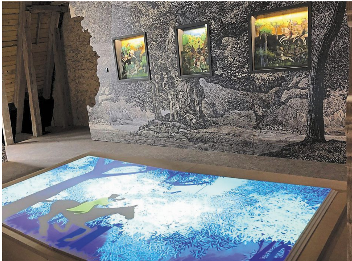
Baugé, mai 2021. Le château de Baugé rouvre le 25 mai avec une nouvelle scénographie permettant d'apprécier la fonction palatiale du monument, recherchée par son bâtisseur le roi René.