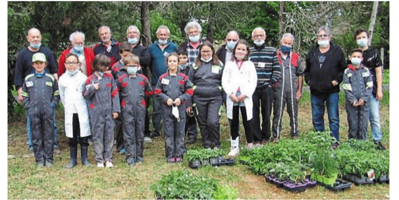
Le groupe de bénévoles et de jeunes apprentis.

L'association L'Outil en main de Seiches-sur-le-Loir ouvre ses portes, aux professionnels, parents et partenaires, mercredi 26 mai de 14 heures à 17 heures et samedi 29 mai de 10 heures à 17 heures, au 33 bis, rue Pasteur. Ces journées seront l'occasion de mieux connaître le projet, de faire connaissance avec les bénévoles, de découvrir les locaux et les métiers proposés. Elles permettront aussi de pré-inscrire son enfant pour la rentrée prochaine.