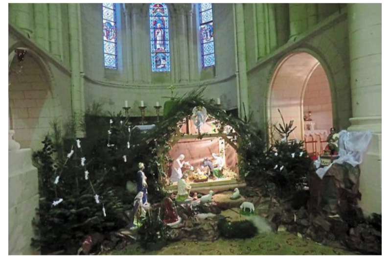
Les personnages de la crèche ont tous été restaurés.