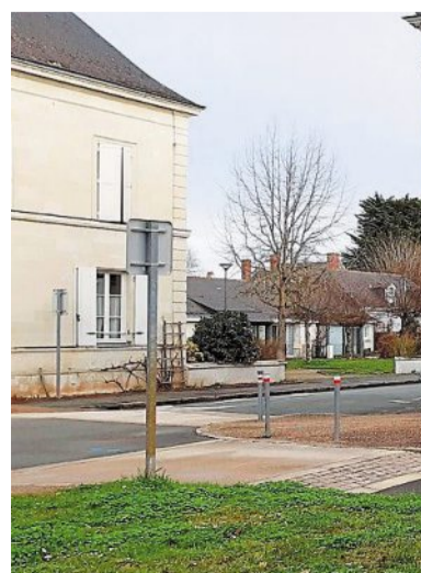
L'ancien tabac presse que la commune a décidé d'acquérir

Le prochain conseil municipal se tiendra le 17 février 2021.