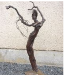
Ghislaine Chaveton Exposante au château de Baugé-en-Anjou Sculptrice sur métal et céramiste www.instagram.com/gui louchavt/