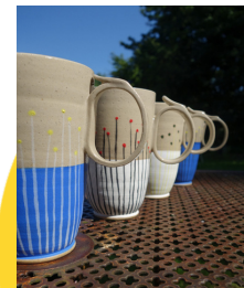
Laghia Sanz Invitée à l'atelier « Céramique à la folie » 845 Route des Carriots, Montpollin, 49150 Baugé-en-Anjou www.laghiasanz.fr/