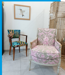
Laurence Carette Exposante au château de Baugé-en-Anjou Tapissier-garnisseur